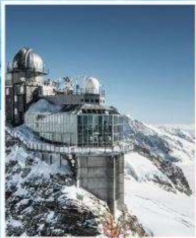
JUNGFRAUJOCH "Top of Europe"