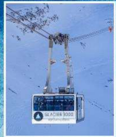
GLACIER3000 Peak walk by Tissot