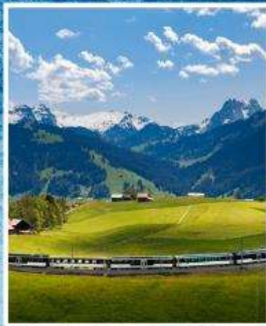
GOLDEN PASS LINE Montreux-Zweisimmen