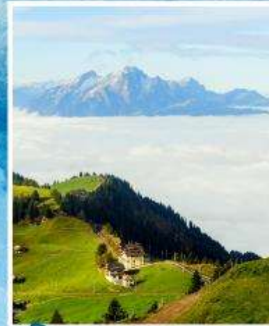
RIGI KULM Queen of the Mountains