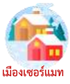
เมืองเซอร์แมท

เช้า บริการอาหารเช้า ณ ห้องอาหารของโรงแรม (11)