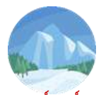
เทือกเขาคอร์เนอร์แกรต ชมวิวยอดเขาแมทเทอร์ฮอร์น

นำท่านเดินไปยังสถานีรถไฟ เพื่อนั่งรถไฟขึ้นสู่ เทือกเขาคอร์เนอร์แกรต (Gornergrat) (ใช้เวลาในการเดินทางประมาณ 15 นาที) รถไฟคอร์เนอร์แกรตเป็นรถไฟขึ้นภูเขาที่ตั้งอยู่ในรัฐวาเล ที่เชื่อมกับหมู่บ้านเซอร์แมท สถานีรถไฟคอร์เนอร์แกรต ให้ท่านถ่ายรูปตามอภินิหาร ชมวิวยอดเขาแมทเทอร์ฮอร์น (Matterhorn) มงกุฎแห่งสวิตเซอร์แลนด์ นำท่านนั่งรถไฟคอร์เนอร์แกรตลงมาสู่ เมืองเซอร์แมท อิสระให้ท่านเดินชมเมืองเซอร์แมท และพักผ่อนตามอภินิหาร นำท่านเดินทางสู่ เมืองทาช (Tasch) ด้วย Shuttle Train จากสถานีรถไฟเซอร์แมท สู่สถานีรถไฟทาช (ใช้เวลาในการเดินทางประมาณ 30 นาที)