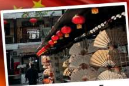
ถนนโบราณซูหยวนเหมิน

"มรดกโลกพันปี สุสานทหารดินเผา" แต่งชุดจีนโบราณ เดินถนนวัฒนธรรมต้าถิง