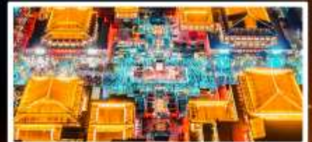
ถนนวัฒนธรรมต้าถิง