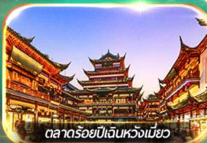
ตลาดร้อยปีเดินหวังเหมียว