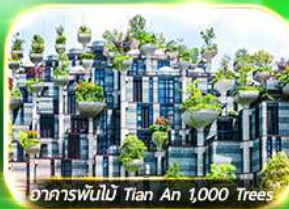
อาคารพันไม้ Tian An 1,000 Trees