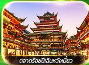
ตลาดร้อยปีเงินหวงเหมียว