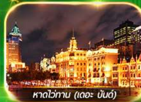
หาดว่ทาน (เดอะ บันด์)

เที่ยวมหานครเซี่ยงไฮ้ ถ่ายรูปเช็คอินท์ Tian An 1000 Trees, ซินเทียนตี้ ช้อปปิ้งตลาดเงินหวงเหมียว, ถนนนานกิง