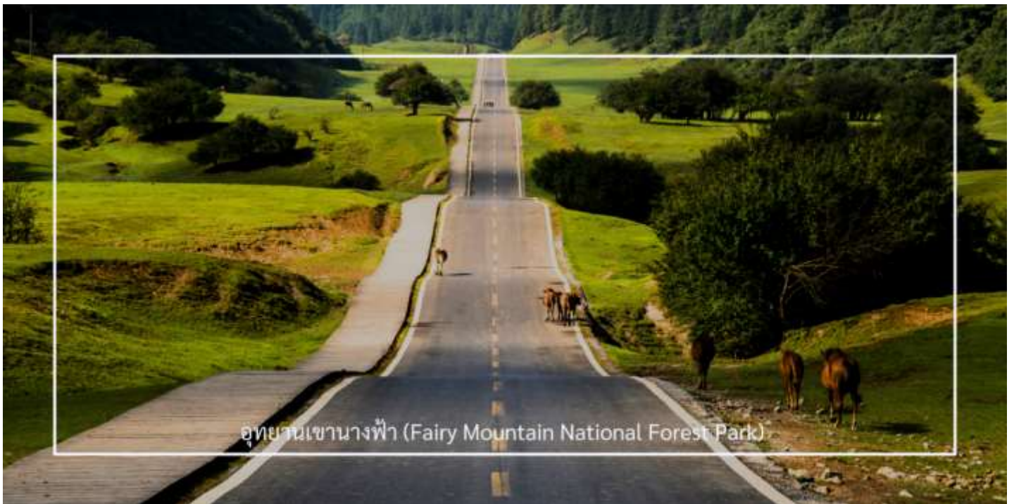
อุทยานเขานางฟ้า (Fairy Mountain National Forest Park)

นำท่านสู่ อุทยานเขานางฟ้า (Fairy Mountain National Forest Park) (รวมค่ารถไฟขบวนเล็กภายในอุทยาน) อุทยานเขานางฟ้า ตั้งอยู่ในเขตอู่หลง มหานครฉงชิ่ง ประเทศจีน เป็นสถานที่ท่องเที่ยวทางธรรมชาติระดับ 5A ของประเทศโดดเด่นด้วยภูมิประเทศแบบที่ราบสูงอัลไพน์ ปกคลุมด้วยทุ่งหญ้ากว้าง ป่าไม้เขียวขจี และยอดเขาสลับซับซ้อน สวยงามราวภาพวาด ด้วยบรรยากาศเย็นสบายตลอดทั้งปี ที่นี่จึงได้รับฉายาว่า “สวิตเซอร์แลนด์แห่งจีน” อุทยานครอบคลุมพื้นที่กว่า 330 ตารางกิโลเมตร มีระดับความสูงเฉลี่ยกว่า 2,000 เมตรจากระดับน้ำทะเล ท่านสามารถเพลิดเพลินกับการเดินเล่นชมธรรมชาติ ชมทิวทัศน์อันงดงามของภูเขา พร้อมบริการรถไฟขบวนเล็ก ที่จะพาท่านชมวิวม่านน้ำท่ามกลางธรรมชาติได้อย่างสะดวกสบาย