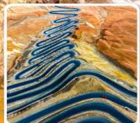
ถนนผานหลงตู้ต้าว