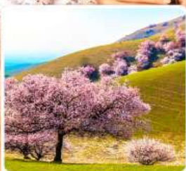
ทุ่งดอกอัลมอนต์