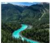
อุทยานคานาสือ