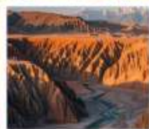
แกรนด์แคนยอนดูซานจื่อ