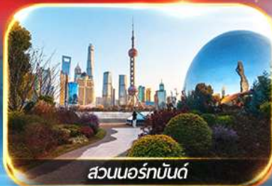
สวนนอร์มัลด์