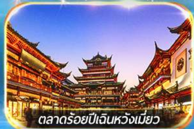
ตลาดร้อยปีเงินหวงเมียว

ถ่ายรูปชมสวนนอร์มัลด์ , เขาคินหาดไว่กาน, วัดพระหยกขาว อิสระช้อปปิ้งถนนนานกิง POPMART FLAGSHIP STORE