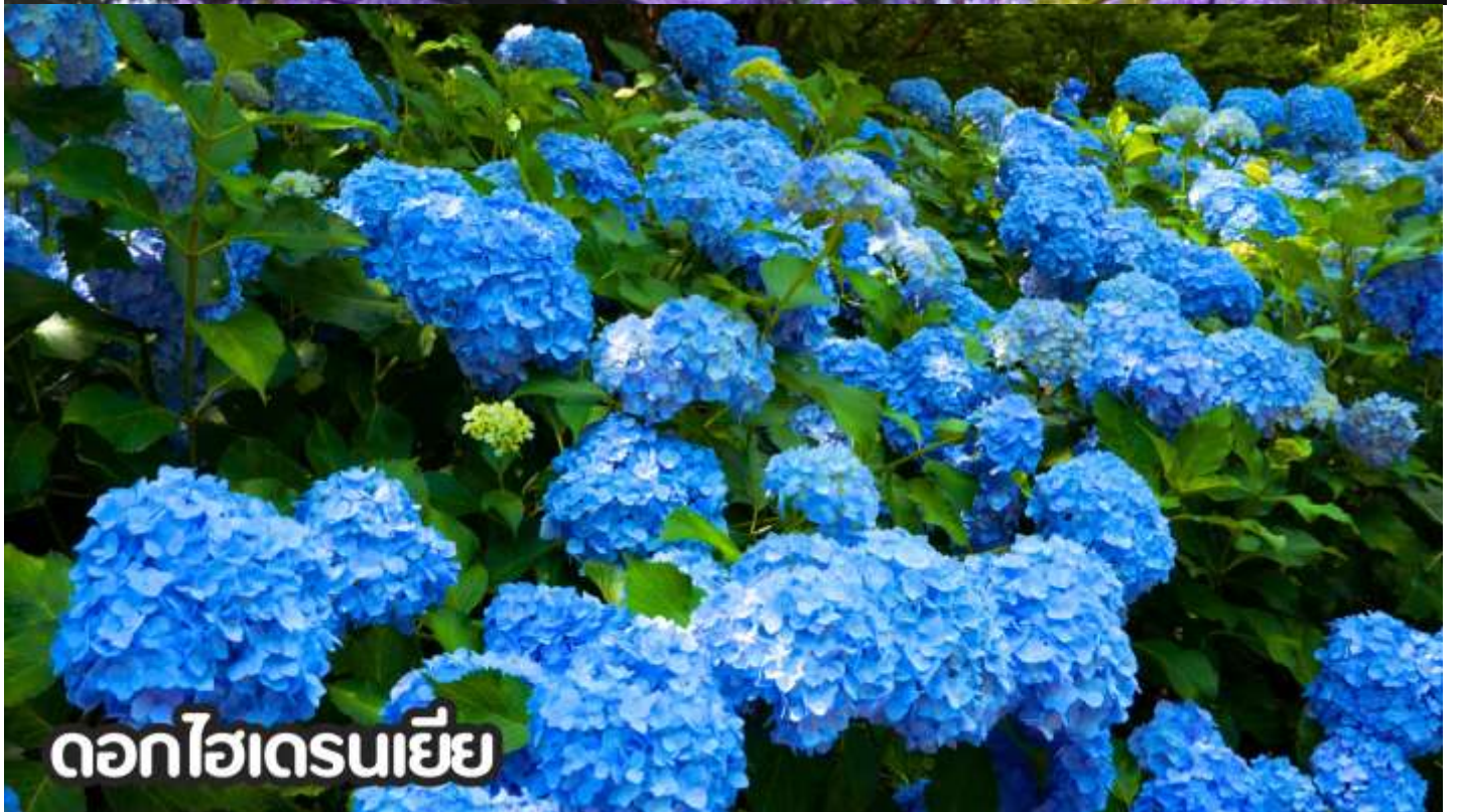
ดอกไฮเดรนเยีย

**หมายเหตุ: โปรแกรมชมดอกไม้ช่วงเดือน พ.ค. - ต.ค.2569 ในช่วง ณ วันเดินทางดังกล่าว หากดอกไม้ยังไม่บานหรืออาจจะร่วงหล่น..ทั้งนี้ขึ้นอยู่กับสภาพอากาศของแต่ละปี ทางบริษัทไม่ประกันและไม่สามารถกำหนดการบานของดอกไม้ได้ ทางบริษัทฯ ขอสงวนสิทธิ์ปรับเปลี่ยนรายการท่องเที่ยวอื่นทดแทนนะคะ รบกวนท่านโปรดทราบและทำความเข้าใจค่ะ**