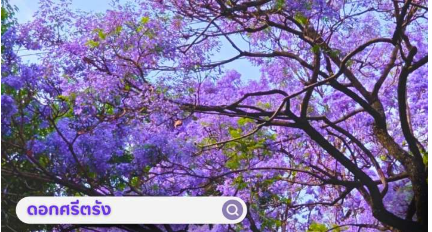
ดอกศรีตรัง

เดือนกันยายน: นำท่านชม ตลาดดอกไม้ไต้หวัน เป็นตลาดค้าส่งดอกไม้ที่ใหญ่ที่สุดของจีน เปิดทำการค้าตลอด 24 ชั่วโมง ไม่มีช่วงเวลาปิดทำการ โดยในปี 2566 ตลาดดอกไม้ไต้หวันมีปริมาณการซื้อขายดอกไม้โดยเฉลี่ยรวม 13,540 ล้านบาท คิดเป็นมูลค่า 13,570 ล้านบาท ถือเป็นตลาดค้าปลีก-ส่ง ผลิตผลทางการเกษตรที่ใหญ่ที่สุดในประเทศจีนอีกด้วย