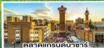
ตลาดแกรนด์บาซาร์