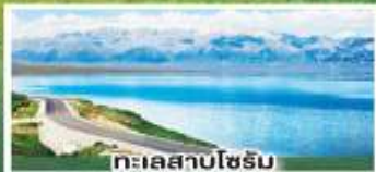
ทะเลสาบไซรัม