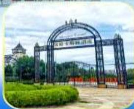
ไร่องานจางยู