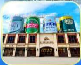
โรงแรมซีจินเต่า