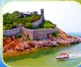
เจดีย์เฝิงโหล