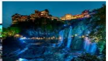
ฟูหรงเจิน

*ทางบริษัทฯ ขอสงวนสิทธิ์ในการสลับโปรแกรมทัวร์ตามความเหมาะสมขึ้นอยู่กับสถานการณ์หน้างาน โดยคำนึงถึงผลประโยชน์ของลูกค้าเป็นสำคัญ