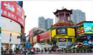
ถนนหวงซิงลู่