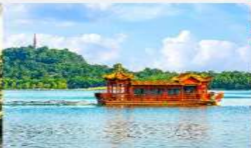
ล่องเรือทะเลสาบหลิวเยว่หู