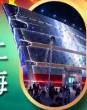
เรือคอะหลุยส์