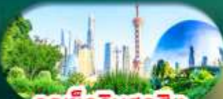
จุดเช็คอินสุดฮิต North Bund Shanghai

เซี่ยงไฮ้ หางโจว ล่องทะเลสาบซีหู ฟรีเดย์