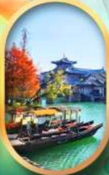
เมืองโบราณผู้หยวน