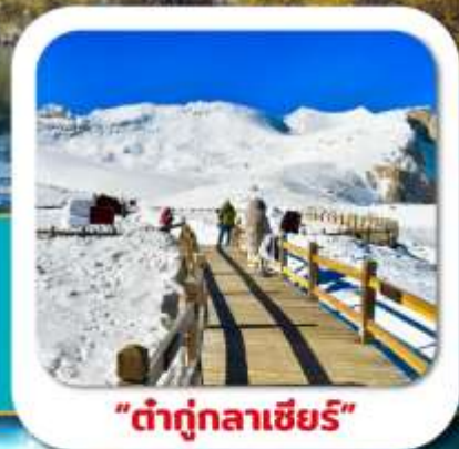
"ต่ากุกลาเซียร์"

เที่ยวชมความงาม 3 อุทยานชื่อดัง : สี่ดรุณี • ปี่เผิงโกว ต่ากุกลาเซียร์ ชมความน่ารักของหมีแพนด้า • จัดรสหยางเทียนวู่ ชอยกวางชอยแคม • ถนนคนเดินซุนซี้สู • POP MART