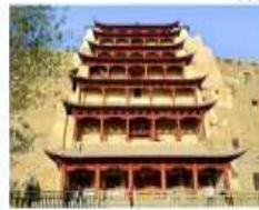
ถ้ำม่อเกา