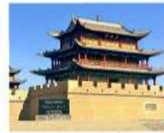
ถ้ำเพงเจียยี่กวน