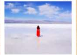
ทะเลสาบเกลือฉางซ่า