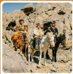
ชาวมองโกล