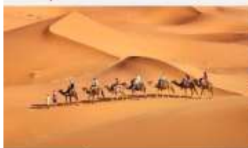
ยี่จู่ซุมทะเลทราย