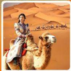
ขี่อูฐชมทะเลทราย