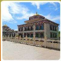
ทำเนียบพระลามะอูหลาน

● ไอโสรท์ เป็นทรายเลี้ยงชาวมองโกล แหล่งท่องเที่ยวระดับ 5A ของจีน แกรนด์แคนยอนแม่น้ำเหลือง ซิวซูท่ามกลางทะเลทราย