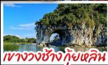
เขางวงช้าง กุ้ยเจลิน