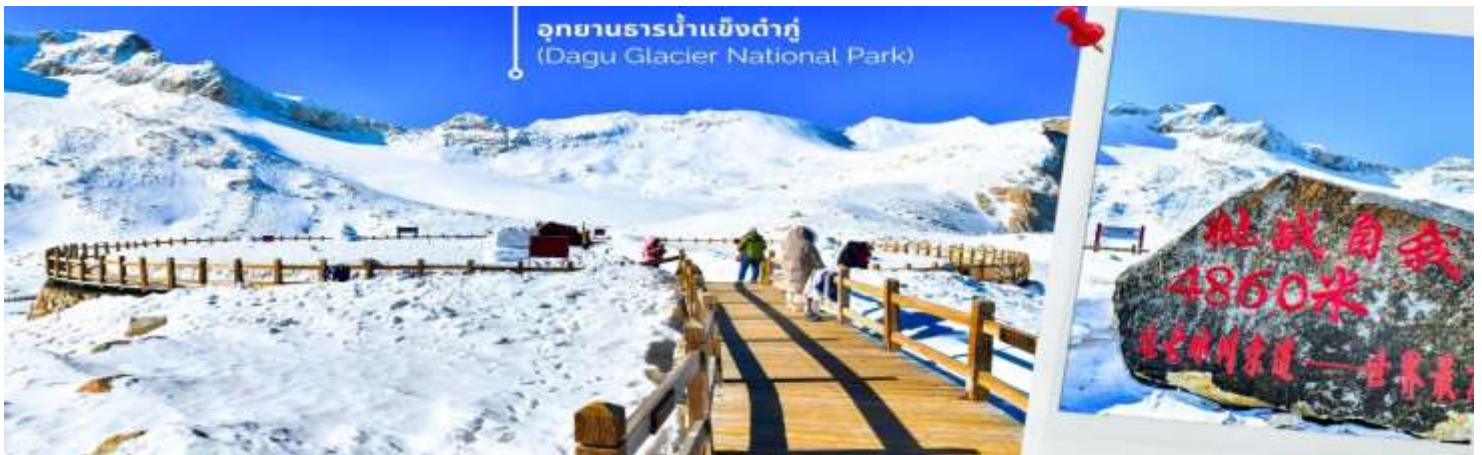
การตกและความหนาวของหิมะขึ้นอยู่กับสภาพอากาศ

จากนั้นนำท่านเดินทางสู่ เมืองเฮยฮุย (ใช้เวลาเดินทางประมาณ 2 ชั่วโมง)เพื่อเดินทางไปยัง อุทยานธารน้ำแข็งต้ากู่ปิงชว่น(รวมกระเช้าขึ้นลง) ต้ากู่ปิงชว่น หรือ Dagu Glacier National Park เป็นธารน้ำแข็งกลางเขี้ยวที่สวยงามที่สุดแห่งหนึ่งของโลก และเป็นสถานที่ท่องเที่ยวระดับ 4A ของจีน ตั้งอยู่ที่เมืองเฮยฮุย ในมณฑลเสฉวน ห่างจากเมืองเฉิงตูประมาณ 300 กิโลเมตร ถือเป็นธารน้ำแข็งที่อายุน้อยที่สุด ที่ตั้งอยู่ในระดับความสูงที่ต่ำที่สุด และอยู่ใกล้กับเมืองมากที่สุดในบรรดาธารน้ำแข็งทั้งหมด โดยอยู่สูงจากระดับน้ำทะเลประมาณ 3,800-5,100 เมตร จุดสูงที่สุดที่นักท่องเที่ยวสามารถขึ้นไปได้จะอยู่ที่ 4,860 เมตร