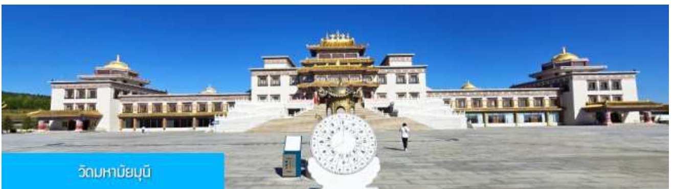
วิถมหาบุญ

พักที่ YULIN CHAOYANG INTER HOTEL โรงแรมระดับ 4 ดาวท้องถิ่น หรือเทียบเท่าในเมืองหยี่หลิน