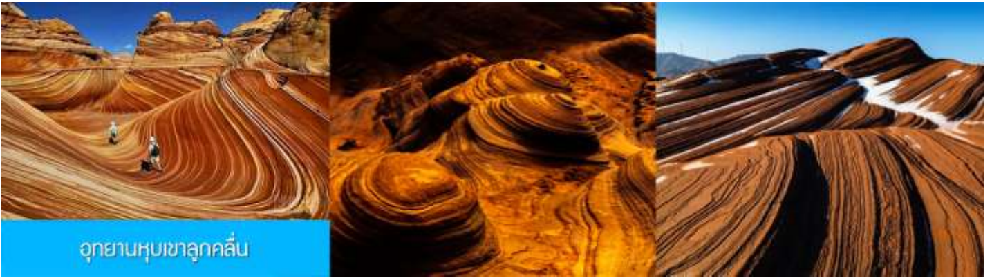
อุทยานหุบเขาลูกคลื่น