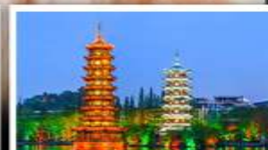
เจดีย์เงินเจดีย์ทอง