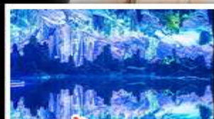
ถ้ำผู่ฮ้อ