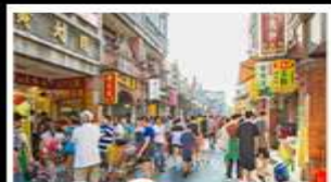
เมืองโบราณต้าชี่

ล่องแพไม้ไผ่ชมแม่น้ำหลี่เจียง - กางวงช้าง ทำผู่ฮ้อ - เมืองโบราณต้าชี่ เจดีย์เงินเจดีย์ทอง ซ้อปั้งถนนคนเดิน - ถนนคังซีเซียง - ถนนซีเจียง เมบูพิศษ บูฟฟ้าบูชี่ฟู้ด ปลายอนเบียร์ สุกี้หืด