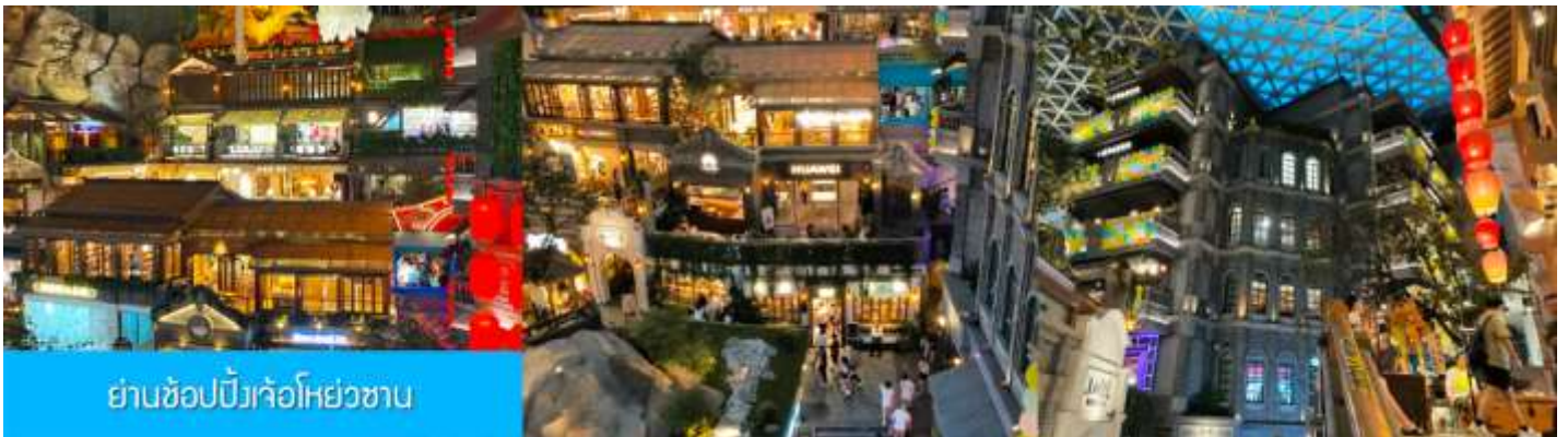
ย่านช้อปปิ้งเก๋โอห่วยชวน

นำท่านเที่ยวชม ย่านช้อปปิ้งเจ้อโอห่วยชวน 这有山 แหล่งช้อปปิ้งชั้นชื้อที่ผสมผสานระหว่างสถานที่ท่องเที่ยว และแหล่งรวมร้านค้า และร้านอาหารฟาสต์ฟู้ด อาหารพื้นเมืองร่วมสมัย ภายใต้คอนเซ็ปต์ แหล่งช้อปปิ้งบนภูเขา และบนภูเขามีแหล่งช้อปปิ้ง เป็นจุดเช็คอินยอดนิยมที่เปิดให้คนพื้นที่และนักท่องเที่ยวเข้าชมตั้งแต่ปี ค.ศ. 2019