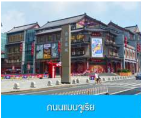
ถนนแมนจูเรีย