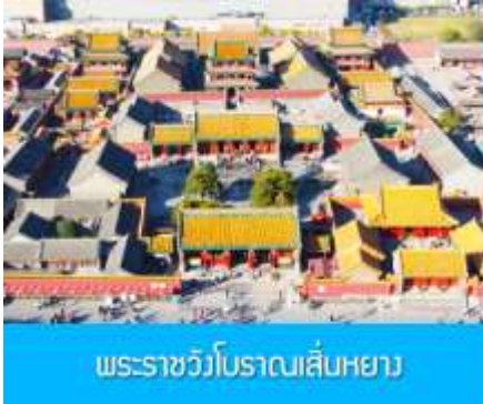
พระราชวังโบราณเสิ่นหยาง

รับประทานอาหารเช้า ณ ห้องอาหารของโรงแรม (4)