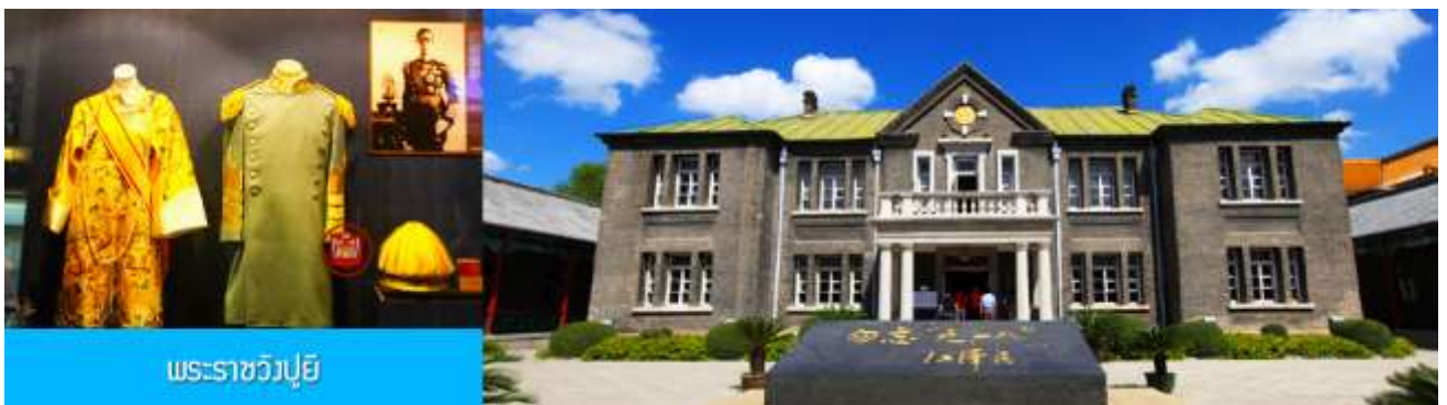
พระราชวังปูยี

รับประทานอาหารเช้า ณ ห้องอาหารของโรงแรม (7)