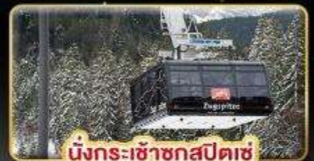
นั่งกระเช้าชุกสปีตซ์