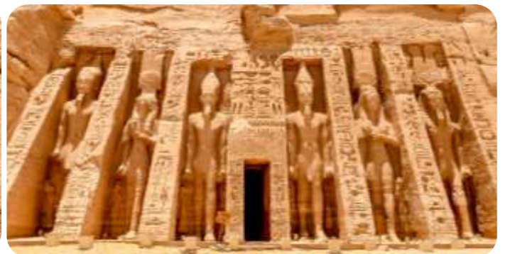
สมควรแก่เวลานำท่านเดินทางกลับเมืองอัสวาน