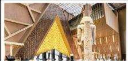
พิพิธภัณฑ์แกรนด์อียิปต์(GEM)

อารยธรรมลุ่มแม่น้ำไนล์ - พีรามิด - อเล็กซานเดรีย - แมมฟิส - ไคโร - โรงแรมระดับ 4 ดาว รวมค่าวีซ่า ตะลุยกะเลทราย - อาหารครบทุกมื้อ