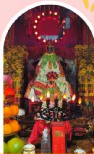
วัดเจ้าแม่กวนอิมอ่องฮำ

ความสำเร็จ ความมั่งคั่ง เงินทองไหลมาเทมา