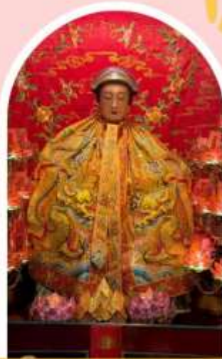
วัดหลังโหมว

ความสำเร็จ ความมั่งคั่ง เงินทองไหลมาเทมา