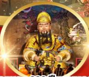
วัดเซกง 600 ปีหยุดหลอง