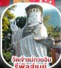
วัดเจ้าแม่กวนอิม ริฟลส์เบย์