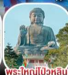
พระใหญ่ไผ่หวิน