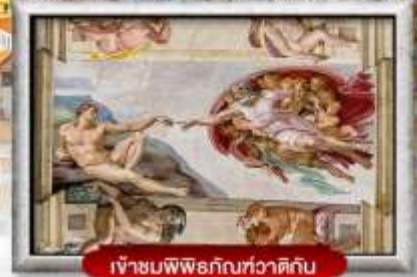
เข้าชมพิพิธภัณฑ์ทวารดิกัน