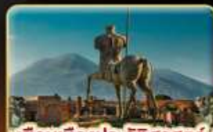
เยือนเมืองประวัติศาสตร์ ปอมเปอี