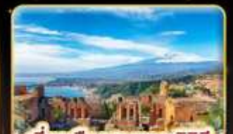
เที่ยวเมืองสวยเกาะซิซิลี Taormina