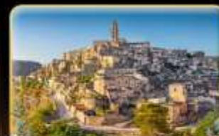
ตามรอย 007 เมือง Matera