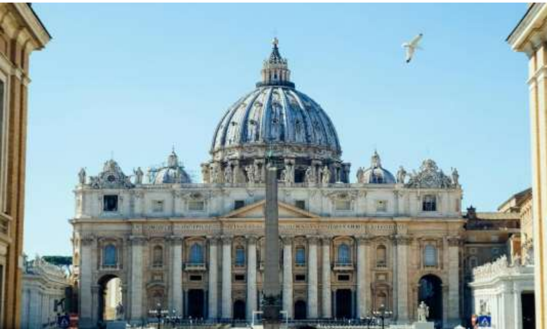
มหาวิหารนักบุญปีเตอร์ ( ST. PETER' BASILICA)