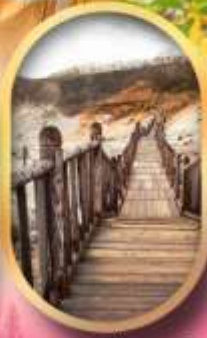
หุบเขาจิทอกุคาบิ