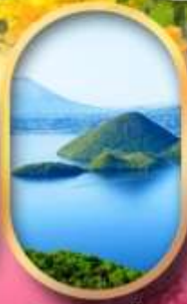
วิวทะเลสาบโทโยะ