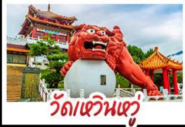
วัดเขวินเซวู

อวลีซาม - ทะเลสาบสุริยอินจันตรา -ไทเป101 วัดหวินหู้ - อนุสรณ์สถานเจียง ไคเชก วัดหลงซาน - ตลาดกลางคืนซีเหมินติง เมนู หม้อหนึ่งจิรพรรดิ - เขียวหลงเป่า - ชาบูไต้หวัน