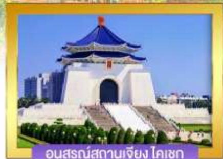
อนุสรณ์สถานเจียง ไคเชก