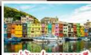
หมู่บ้านประมงหลากสี