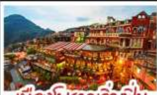
เมืองโบราณจิวเฟิ่น

ฟาร์มแกะซิงจิ้ง - ทะเลสาบสวี่นจินตรา จิวเฟิ่น - หมู่บ้านประมงหลากสี - ไทเป 101 หมู่บ้านสายรุ้ง - ตลาดล่าหู่ & ซีเหมินตง ปลาประ-ธานธิบตี - เขียวหลงเปา