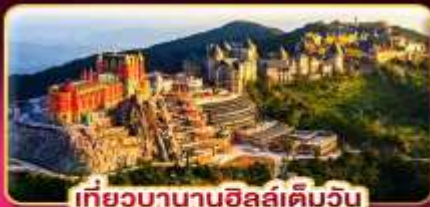
เที่ยวบานาฮิลล์เต็มวัน

ล่องกระทงขามดำคืนที่ฮอยอัน ไฟล์ทสวย บินเช้า-กลับเย็น