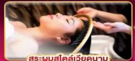
สระผมสไตล์เวียดนาม