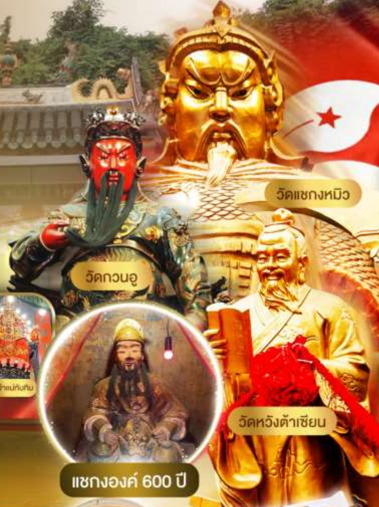
วัดแซกงหมิว