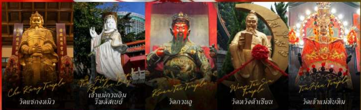
Choi Kung Temple วัดแซกงหนิว

รายการทัวร์ข้างต้นอาจมีการปรับเปลี่ยนเพื่อความเหมาะสม