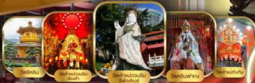
วัดชิวหลิม