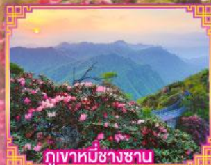
ภูเขาหมีช้างซาน