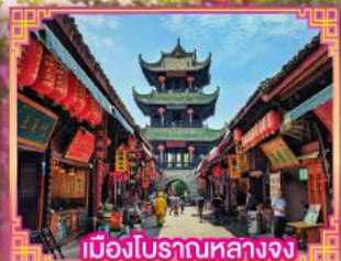
เมืองโบราณหลางจง