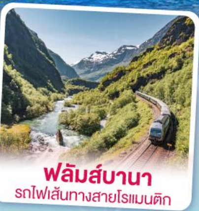
พลิမ်ส์บานา รถไฟเส้นทางสายโรแมนติก