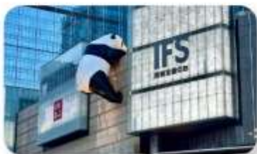
แพนด้าป็นตัก IFS