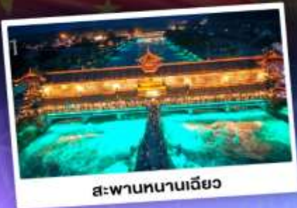
สะพานหนานเฉียว