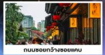
ถนนชอยกว้างชอยแคบ