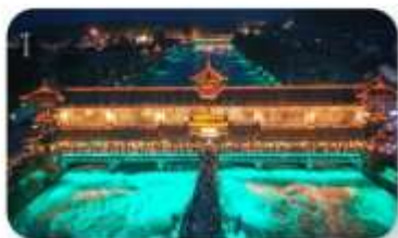
สะพานหนานเจียว