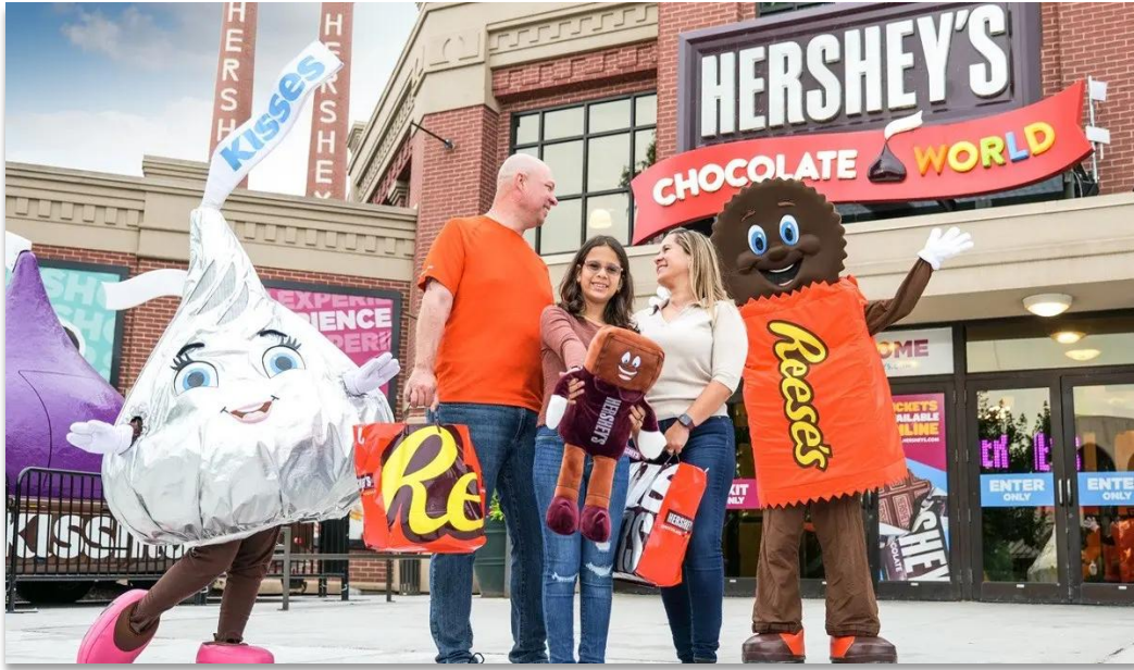
คำ บริการอาหารค่ำ ณ ภัตตาคาร

เข้าชมได้เนื่องจากเดินทางมาถึงล่าช้า บริษัทขอสงวนสิทธิ์ในการไม่คืนเงินหรือชดเชยใด ๆ ในทุกกรณี) ด้วย เครื่องจักรเก่าแก่และเทคนิคการผลิตช็อกโกแลตดั้งเดิมของ HERSHEY'S โรงงานก่อตั้งขึ้น ในปี ค.ศ. 1876 ในโรงงานแห่งนี้ยังมีผลิตภัณฑ์ยอดนิยมอย่าง Hershey's Crystal A ลูกอมคาราเมลรสนม ที่โด่งดังด้วยสโลแกน "Melt in Your Mouth" นำท่านออกเดินทางสู่ "กรุงวอชิงตัน ดี.ซี."