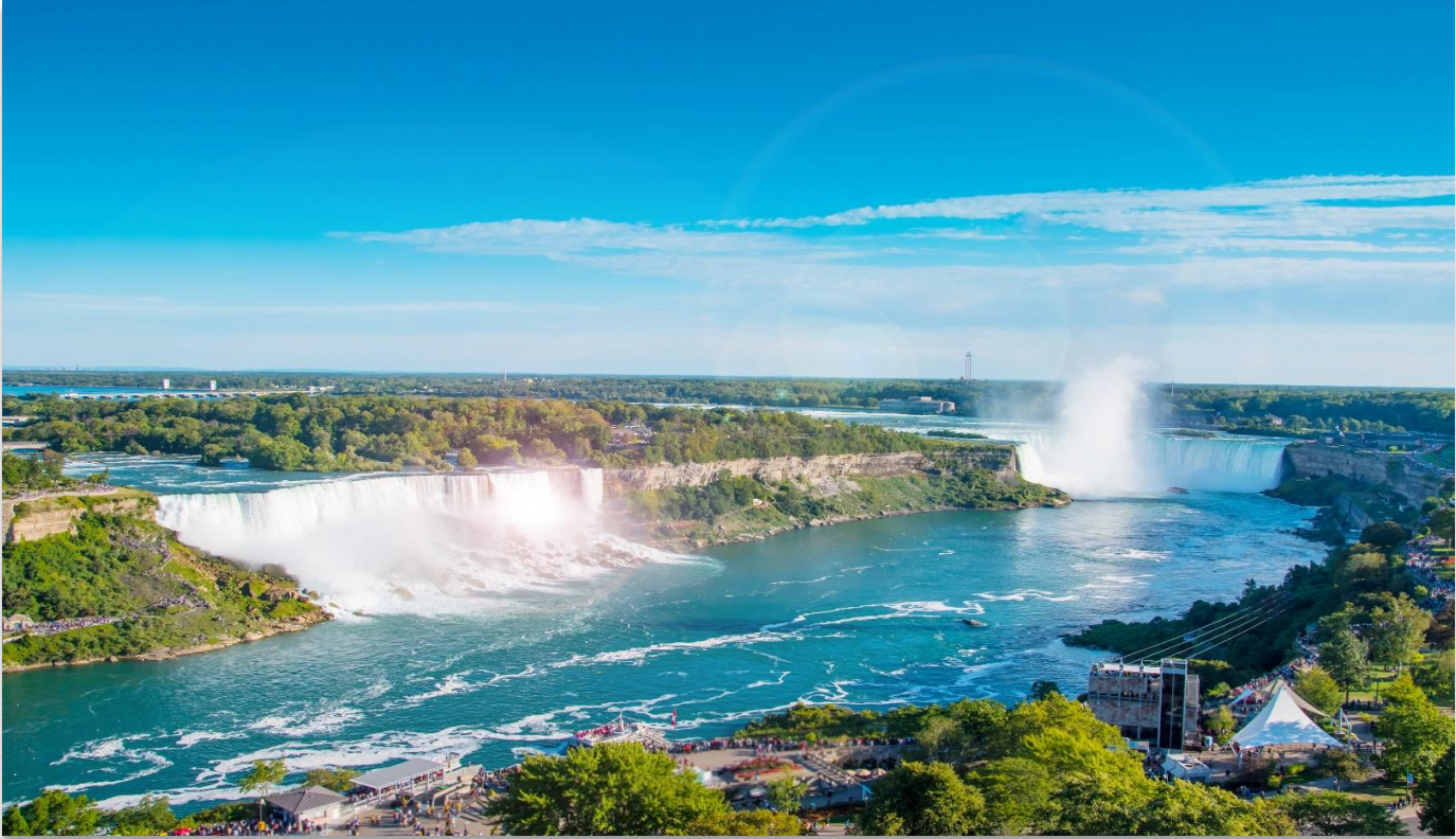
NIAGARA FALLS STATE PARK

นำท่านเดินทางสู่ “อุทยานแห่งชาติไนแอกการ่า” (Niagara Falls State Park) ฝั่งสหรัฐอเมริกา หนึ่งในสิ่งมหัศจรรย์ทางธรรมชาติของโลก ที่ได้รับการยกย่องให้เป็นสถานที่ท่องเที่ยวยอดนิยม และเป็น หนึ่งในสามจุดหมายปลายทางสุดโรแมนติกสำหรับการดื่มด่ำน้ำผั่งพระจันทร์ของคู่บ่าวสาวชาวอเมริกัน น้ำตกไนแอกการ่า