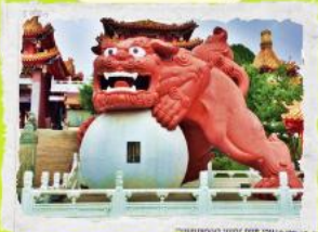
วัดเขวี่งหวู่