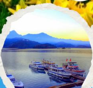
ทะเลสาบสุริยขึ้นจินทารา