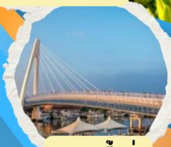
สะพานตงสู่ย