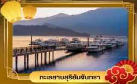
ทะเลสาบสุริยจันทร์