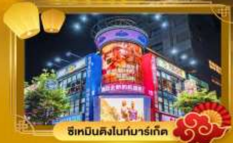
ช้อปปิ้งไนท์มาร์เก็ต