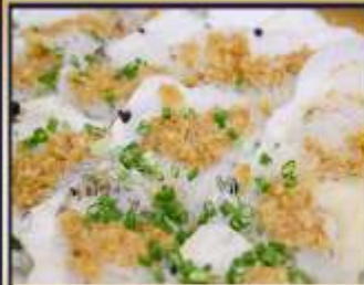
หอยเชลล์อบวุ้นเส้น