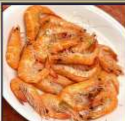
กุ้งหวานลวก