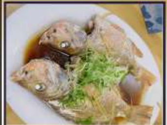
ปลาหนึ่งซีอิ๊ว