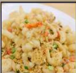
หมึกทอดกระเทียม