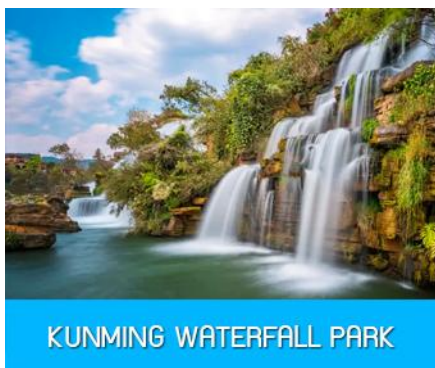
KUNMING WATERFALL PARK

นำท่านรับประทานอาหารกลางวัน ณ ภัตตาคาร (13)