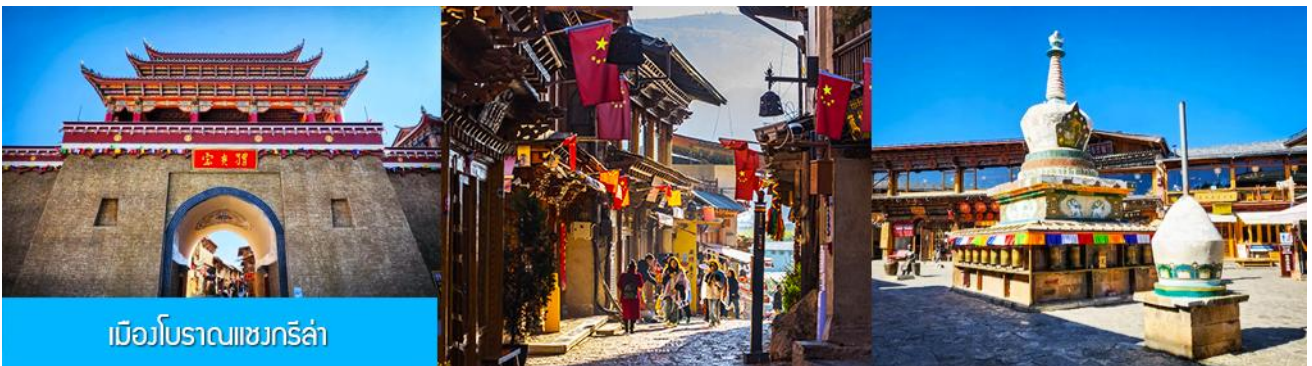
เมืองโบราณเซงกรีล่า