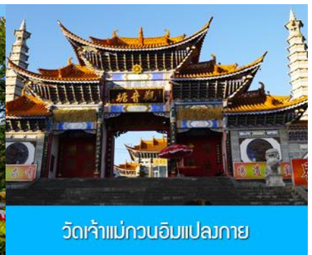
วัดเจ้าแม่กวนอิมแปลงกาย