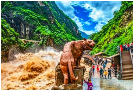
ช่องแคบเสือกะโจน