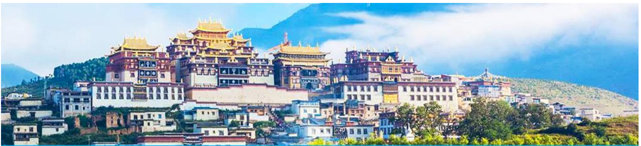
เมืองโบราณเซงกรีล่า