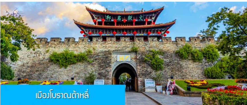
เมืองโบราณต้าลี่

ค่ำ รับประทานอาหารค่ำ ณ ภัตตาคาร (2) หลังอาหารนำท่านเข้าสู่ที่พัก พักที่ DALI ZHUANG YUAN HOTEL ระดับ 4 ดาวหรือเทียบเท่าในเมืองต้าลี่