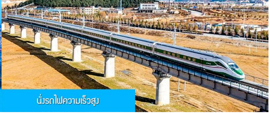
บั้งรถไฟความเร็วสูง