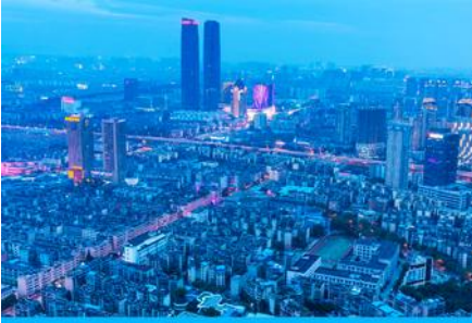
นครคุนหมิง