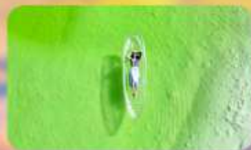
ทะเลสาบเกลือดาเอ๋อร์ฮั่น