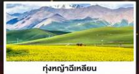
ทุ่งหญ้าฉีเหลียน