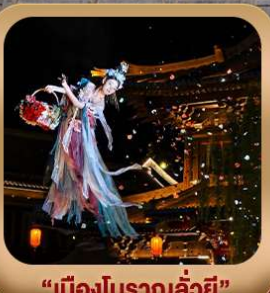
"เมืองโบราณลั่วอี้"

ชมท่าหลงเหมิน มรดกโลกที่เมืองลั่วหยาง • สุสานจีนซีฮ่องเต้ • ศาลเจ้ากวนอู วัดเส้าหลิน + ป่าเจดีย์ + ชมโชว์กังฟู • เมืองโบราณลั่วอี้ • อุทยานหยุนไท่ซาน เจดีย์ห้าพันปี • ถนนวัฒนธรรมต้าถัง • ถนนคนเดินอิสลาม • จัตุรัสหอระฆัง