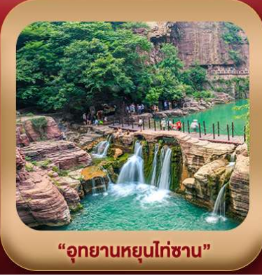
"อุทยานหยุนไท่ซาน"

ชมท่าหลงเหมิน มรดกโลกที่เมืองลั่วหยาง • สุสานจีนซีฮ่องเต้ • ศาลเจ้ากวนอู วัดเส้าหลิน + ป่าเจดีย์ + ชมโชว์กังฟู • เมืองโบราณลั่วอี้ • อุทยานหยุนไท่ซาน เจดีย์ห้าพันปี • ถนนวัฒนธรรมต้าถัง • ถนนคนเดินอิสลาม • จัตุรัสหอระฆัง