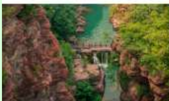
อุทยานสวรรค์หยุนโตซาน